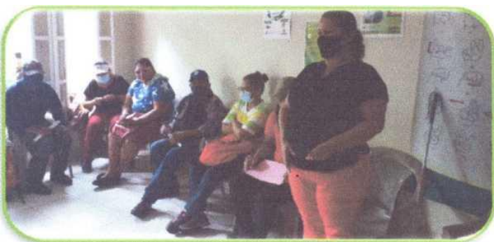
Foto: seis personas sentadas y una de pie. Todas portan mascarilla.

Los días 9 y 10 de noviembre, se llevó a cabo en las instalaciones de la Asociación de Sordociegos de Nicaragua (ASCN) el taller Participación y Liderazgo para el Servicio: Elecciones 2020, en el cual participaron treinta hombres y mujeres miembros activos de la ASCN de los departamentos de Managua, Granada, Masaya y Ocotal.